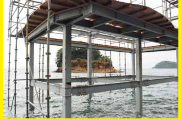
制作中の《ホテル裸島》

時間：10:00～16:00 料金：無料 会場：津奈木町役場付近 定休日：水曜日